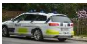
デンマークの救急車 自転車通勤が多い ドイツはスタイリッシュな 自転車が多い