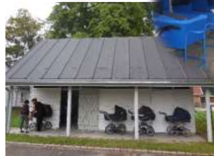
<デンマーク> 屋外での昼寝 (外気に触れる事で 気管支を鍛錬する為)