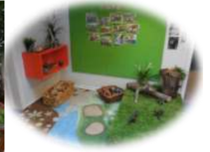
工夫多い保育環境