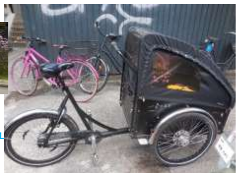
ベビーカー付き自転車