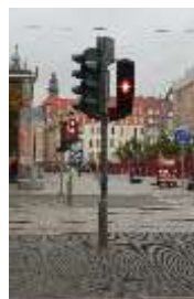
ドイツの信号 ←風力発電が盛んなドイツ