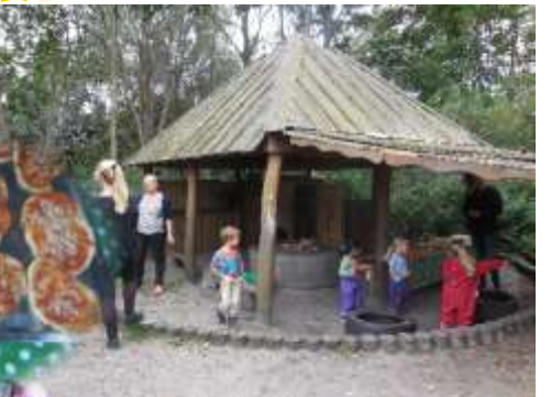
毎日、ピザやパンを作っている