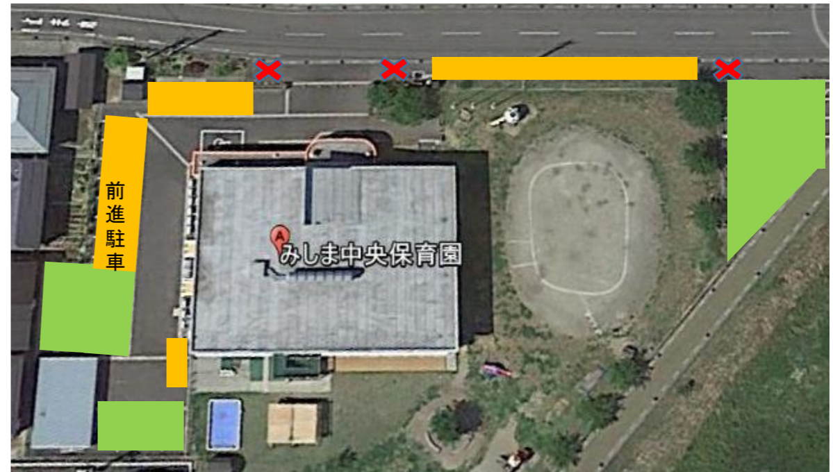
門前は駐車禁止です! ※道路の白線より車が出ないように!